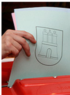
ap Urnengang in Hamburg

Frage: Halten Sie es bezüglich eines grün-schwarzen Bündnisses nicht auch sinnvoll, ökologische und wirtschaftliche Nachhaltigkeit miteinander zu verknüpfen. Ich glaube, hier könnten ideale Kompromisse zu Stande kommen.