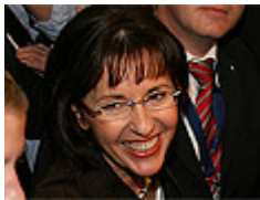
Andrea Ypsilanti